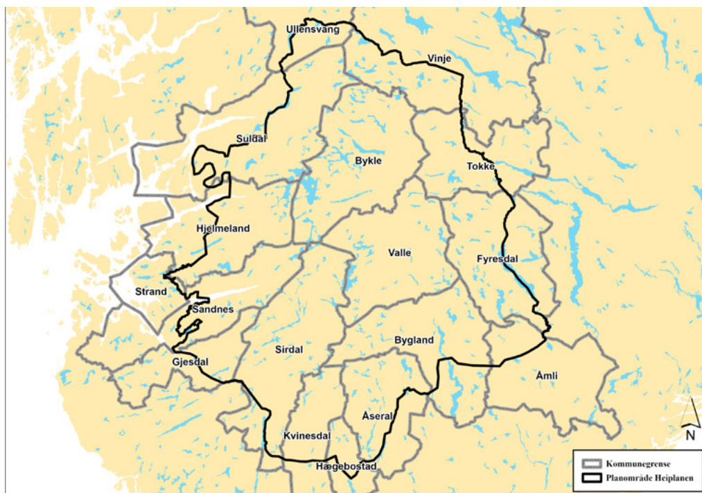
Kartet viser den geografiske avgrensinga til planområdet, svart strek, til Heiplanen, til omsynssone nasjonalt villreinområde, blå strek, og til verneområda i Heiplanen, raud skravur

Heiplanen omfattar etter regionreforma 2020, fylkeskommunane Vestland, Rogaland, Agder og Vestfold og Telemark. I 2024 skil Vestfold og Telemark lag og Telemark fylkeskommune blir med i Heiplanen. Det er 18 kommunar som er omfatta av Heiplanen. Reelt er det 17 kommunar som er med. Strand kommune har grunna svært lite areal i planområdet, ei heller areal i omsynssone nasjonalt villreinområde, ikkje delteke i planarbeidet og i oppfølginga av Heiplanen. Etter kommunereforma, er Forsand og Sandnes slått saman til Sandnes kommune og Odda kommune er slått saman med kommunane Jondal og Ullensvang til Ullensvang kommune